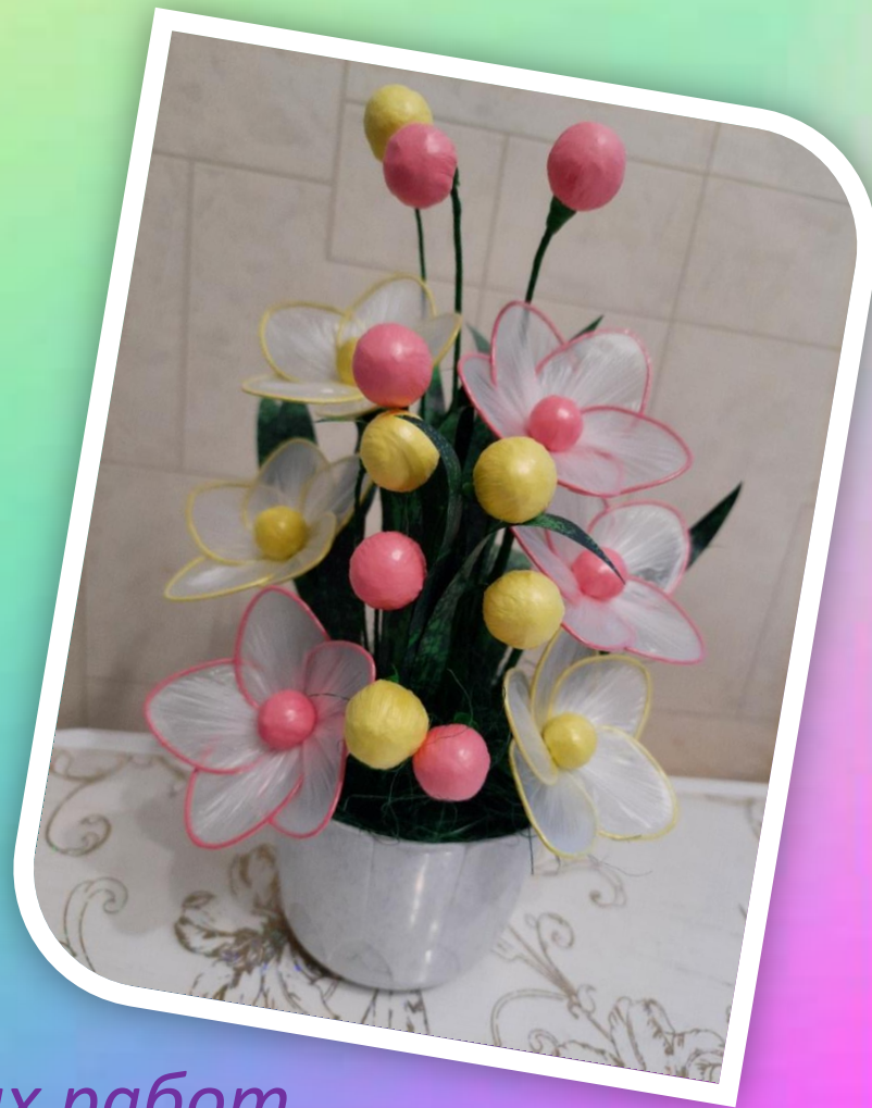
Мини-выставка изготовленных работ